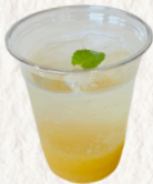
ハニーレモンスカッシュ