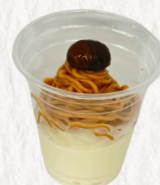
モンブランソフトクリーム