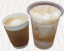
万田酵素カフェラテ