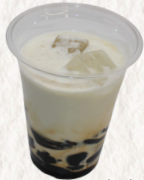
万田酵素コーヒーゼリーオレ