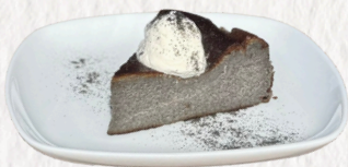
黒ごまのバスクチーズケーキ